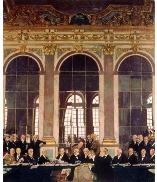
La signature du traité de Versailles (Tableau de W. Orpen, 1919)

Des traités particuliers règlent les questions concernant l'empire autrichien qui est démantelé. On assiste à la naissance de nouveaux états : Yougoslavie, Hongrie, Tchécoslovaquie, Pologne, Lituanie, Lettonie, Estonie aux dépens de l'Autriche, de l'Allemagne et de la Russie. La France reconquiert l'Alsace-Lorraine et s'installe dans la Sarre. L'empire colonial allemand est partagé par les alliés (traité de Versailles en 1919).