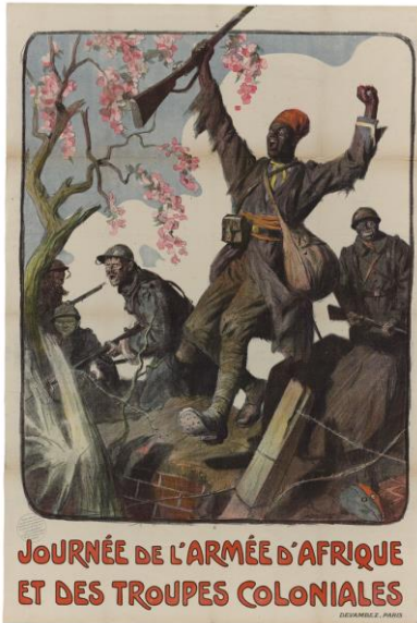
Mobilisation des soldats de l'empire coloniale.

1. Observe les documents ci-dessous et réponds aux questions :