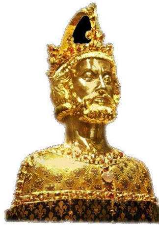
Doc 2 : Le buste de Charlemagne, trésor de la cathédrale d'Aix-la-Chapelle fait après 1349.