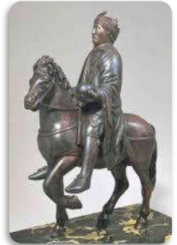
Doc 3 : Statue de Charlemagne, au musée du Louvre.

❶ Quel est le 1 er roi de la dynastie des Carolingiens ? _____