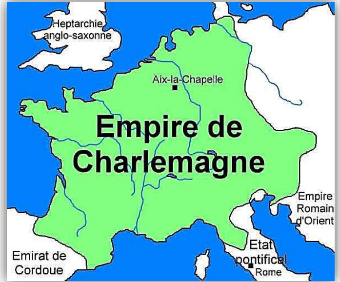
Doc 1 : L'empire de Charlemagne en 814

Charlemagne aide plusieurs fois le pape contre ses ennemis, resserrant ainsi les liens entre l'Eglise et royauté. En l'an 800, le jour de Noël, il est couronné empereur par le pape, à Rome.