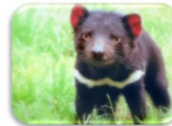
Le diable de Tasmanie