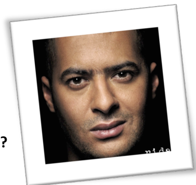
Ridan (extrait de l'album « l'ange e mon démon »)